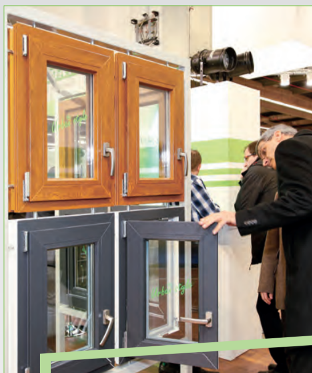
Schöne Ecken im Fokus der Besucher.

Fenster der neuen Generation waren der Hingucker am Stand