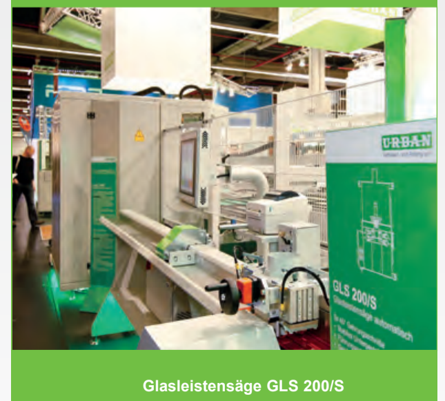
Glasleistensäge GLS 200/S