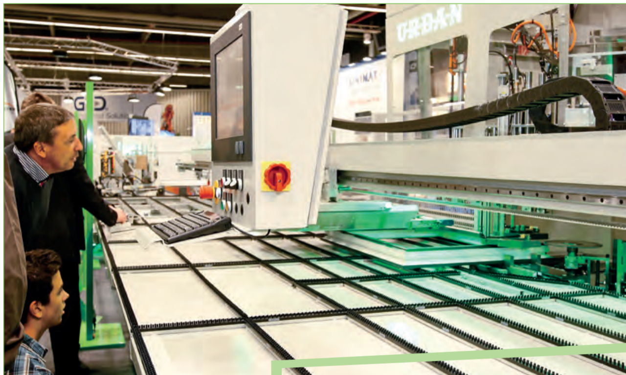
Da schau her: So macht es Urban.