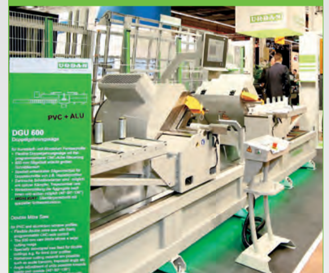
Doppelgehrungssäge DGU 600