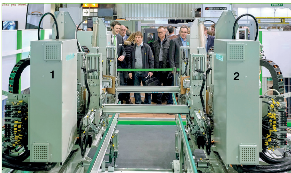
Die Schweißverfahren von Urban sollen wieder einmal für Wow-Effekte sorgen.

Auch bei der Fensterbau/ Frontale 2020 wird sich alles wieder um die „schönen Ecken“, drehen. Diese