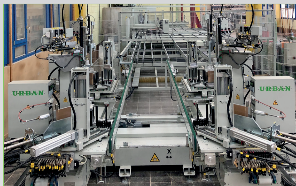
Die Urban-Linie mit AKS 6410 und SV 530/4-C hat auch die großen Elemente voll im Griff.