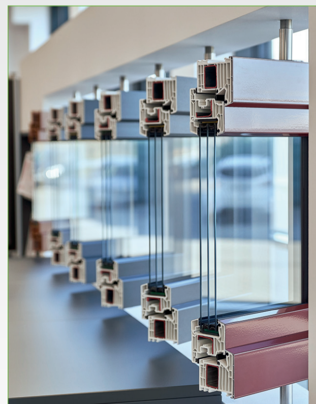
Die neue Ausstellung von Bruckbauer in Cham-Altenmarkt.

Kontakt: 08331/858-270 andreas.pauls@ u-r-b-a-n.com