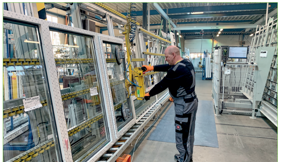
MB Fenstertechnik hat händische Abläufe technisch unterstützt und logistisch optimiert.