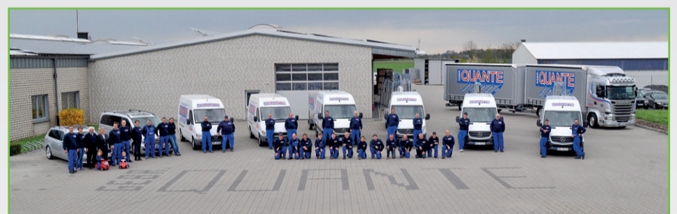
Ein Team, ein Gen: Gebrüder Quante in Südkirchen.

Kontakt: 08331/858-246 hermann.deller @u-r-b-a-n.com