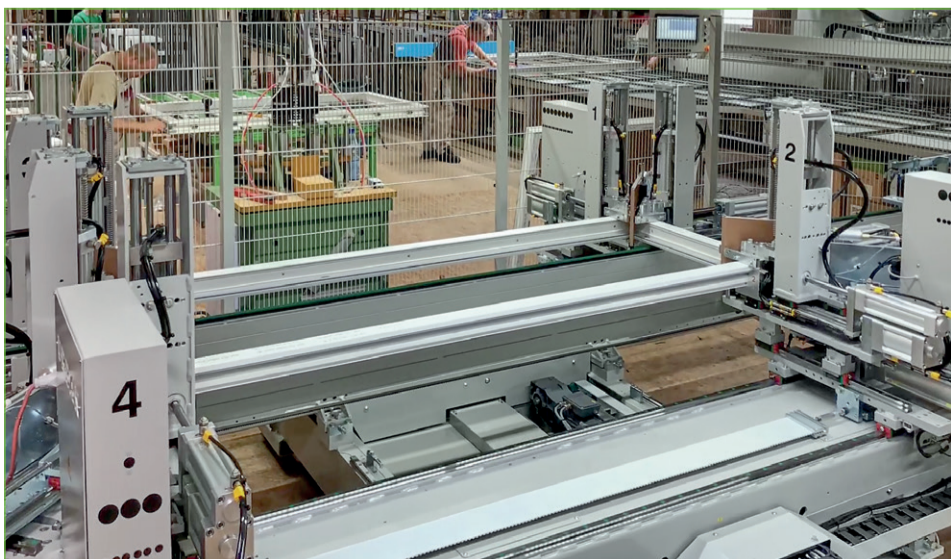
Die AKS 6410/4 von RB Reinert wechselt die Zulagen automatisch.

„Jede Fertigung ist anders. Bei MB Fenstertechnik mussten wir die Logistik in eine extrem schmale Halle integrieren. Da musste ich meine grauen Zellen schon etwas anstrengen. Toll, dass es wieder geklappt hat“, so der Mr. Logistik von Urban.