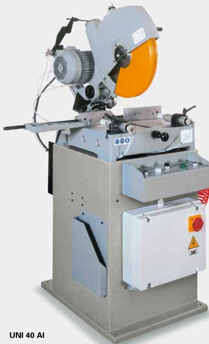
UNI 40 AI